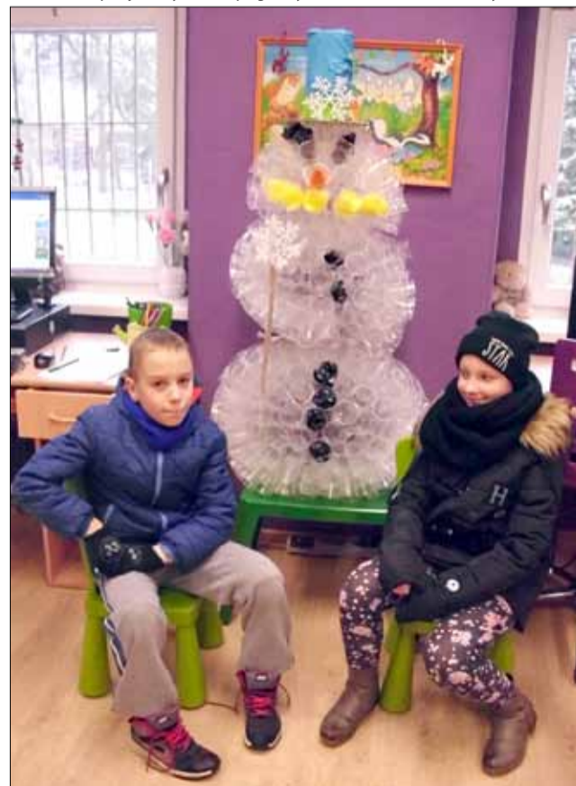
Dzieci z Nowolesia „ulepiły” balwana z ... plastikowych kubeczków

Ferie zimowe już za nami. Przez dwa tygodnie w Strzelińskim Ośrodku Kultury i świetlicach wiejskich odbywało się sporo zajęć dla dzieci i młodzieży. W ofercie znalazły się m.in. warsztaty żonglerki, dziennikarskie, muzyczne, zajęcia z pracy kinooperatora i oświetleniowca, „Bajkę czytam, bajkę widzę”, integracyjne, bal karnawałowy i wiele innych. Najmłodszy z miejscowości, w których nie ma świetlic