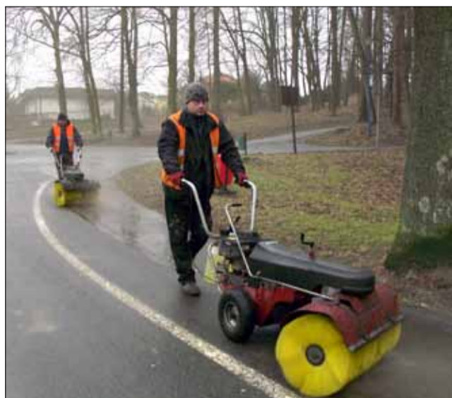
Pracownicy Centrum Usług Komunalnych i Technicznych w Strzelinie rozpoczęli wiosenne porządki w mieście