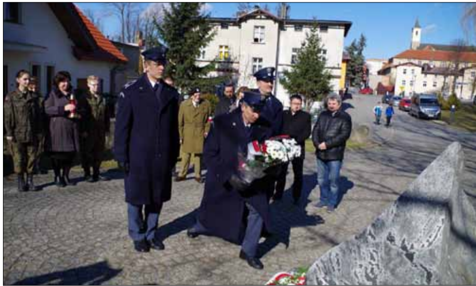
Kwiaty pod obeliskiem złożyła m.in. delegacja Zakładu Karnego w Strzelinie