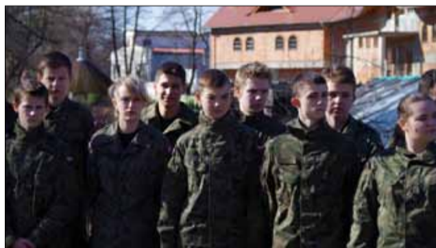
W obchodach święta wzięły udział m.in. klasy mundurowe z Gimnazjum nr 2 w Strzelinie

sądowych. Wielu z nich nie ma nadal mogiły. Żołnierzom wyklętym zadawano podwójną śmierć. Pierwszą - fizyczną, a drugą - skazując ich na zapomnienie. Ich bliscy nie mogli ich pogrzebać. To ważne święto i dzień, ponieważ odzyskujemy pamięć. Skutki działań powojennych władz są zmieniane poprzez