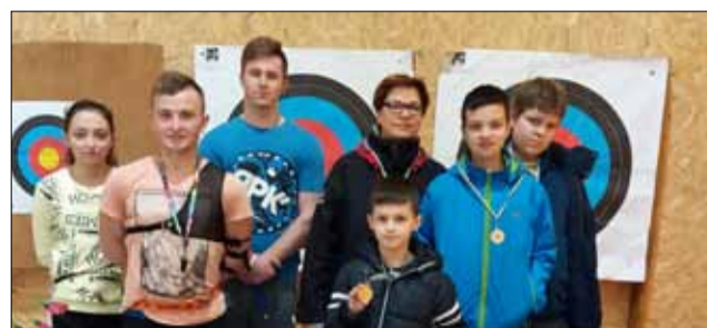
Podczas otwartego sekcji łuczniczej można było zapoznać się techniką strzelania

Strzeleńskie Centrum Sportowo-Edukacyjne przygotowało podczas ferii szereg atrakcji dla dzieci i młodzieży. Amatorzy futbolu rywalizowali w turniejach piłki nożnej, miłośnicy potyczek umysłowych mogli zmierzyć się w turniejach szachowych pod bacznym okiem sędziego Andrzeja Sobolewskiego. Amatorzy łyżwiarstwa swoje umiejętności doskonalili podczas wyjazdów na lodowisko w Świdnicy. Dziecięce reprezentacje wiosek rywalizowały w I Zimowej Spartakiadzie Sołectw. Podczas dnia otwartego sekcji łuczniczej można było zapoznać się techniką strzelania i sprawdzić swoje możliwości.