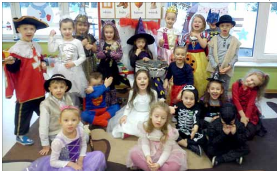
Na bal karnawałowy dzieci przebrały się za bohaterów znanych bajek