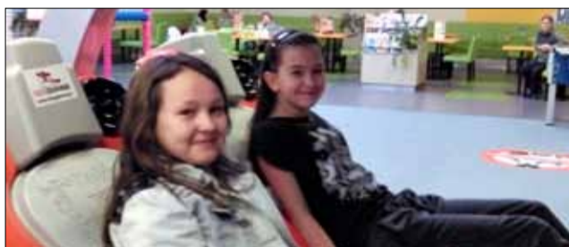
Podczas ferii zimowych dzieci z PSP nr 4 w Strzelinie odwiedziły Centrum Rozrywki Loopy's World we Wrocławiu