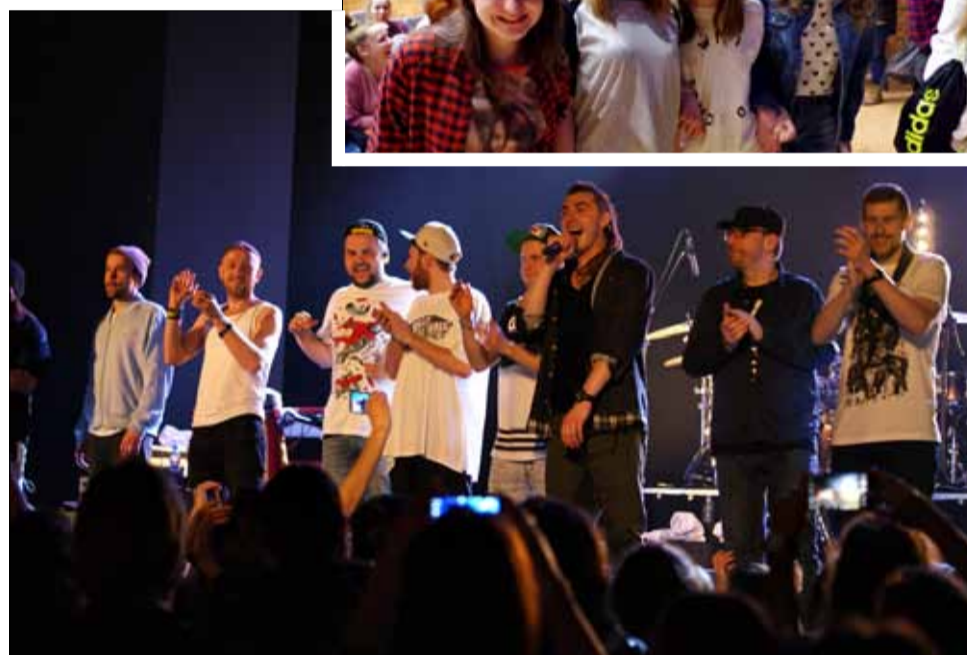
Półtoragodzinny koncert na długo zapadnie w pamięć strzelińskiej publiczności