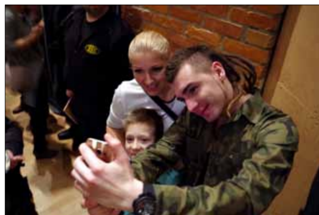
Po występie Kamil Bednarek z chęcią rozdawał autografy i robił sobie zdjęcia z fanami. Pod sceną miejsca brakowało już przed koncertem.

W połowie lutego na deskach Strzelińskiego Ośrodka Kultury wystąpił Kamil Bednarek z zespołem. W sali widowiskowej zgromadziło się sporo fanów muzyki reggae. Już od pierwszych utworów część publiczności skakała pod sceną. Zespół odwdziczył się niesamowitą energią. Nie zabrakło takich utworów jak „Chwile, jak te”, „Cisza”, a także piosenek z najnowszej płyty. Półtoragodzinny koncert na pewno długo zapadnie w pamięć strzelińskiej publiczności. Mimo przeziębienia, Kamil Bednarek, znalazł czas po występie na autografy i wspólne zdjęcia z fanami.