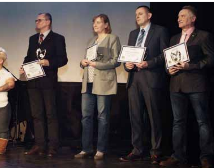
Trener 2016 Roku

Za nami Bieg Pamięci Żołnierzy Wyklętych „Tropem Wilczym”