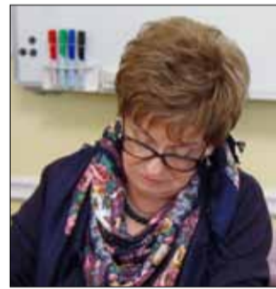
W posiedzeniu komisji uczestniczyła m.in. Wicemarszałek Ewa Mańkowska

Przedstawiciele Dolnośląskiej Służby Dróg i Kolei mówili m.in. o planowanej przebudowie ulicy Wolności i budowie chodnika w Ludowie Polskim. Warto przypomnieć, że ta druga inwestycja będzie współfinansowana przez gminę Strzelin. W tym roku ruszy też budowa drugiego strzeleńskiego ronda przy stacji paliw Orleń (skrzyżowanie ulic Wrocławskiej, Oławskiej i Wolności). Niestety, pod dużym znakiem zapytania stała inna ważna dla gminy Strzelin inwestycja - budowa ścieżki rowerowej na odcinku Strzelin-Szczodrowice. Reprezentanci DSDiK zapowiedzieli też, że w 2017 r. nie będzie więk-