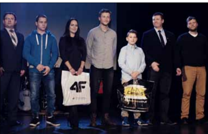
Część nominowanych otrzymała nagrody dodatkowe