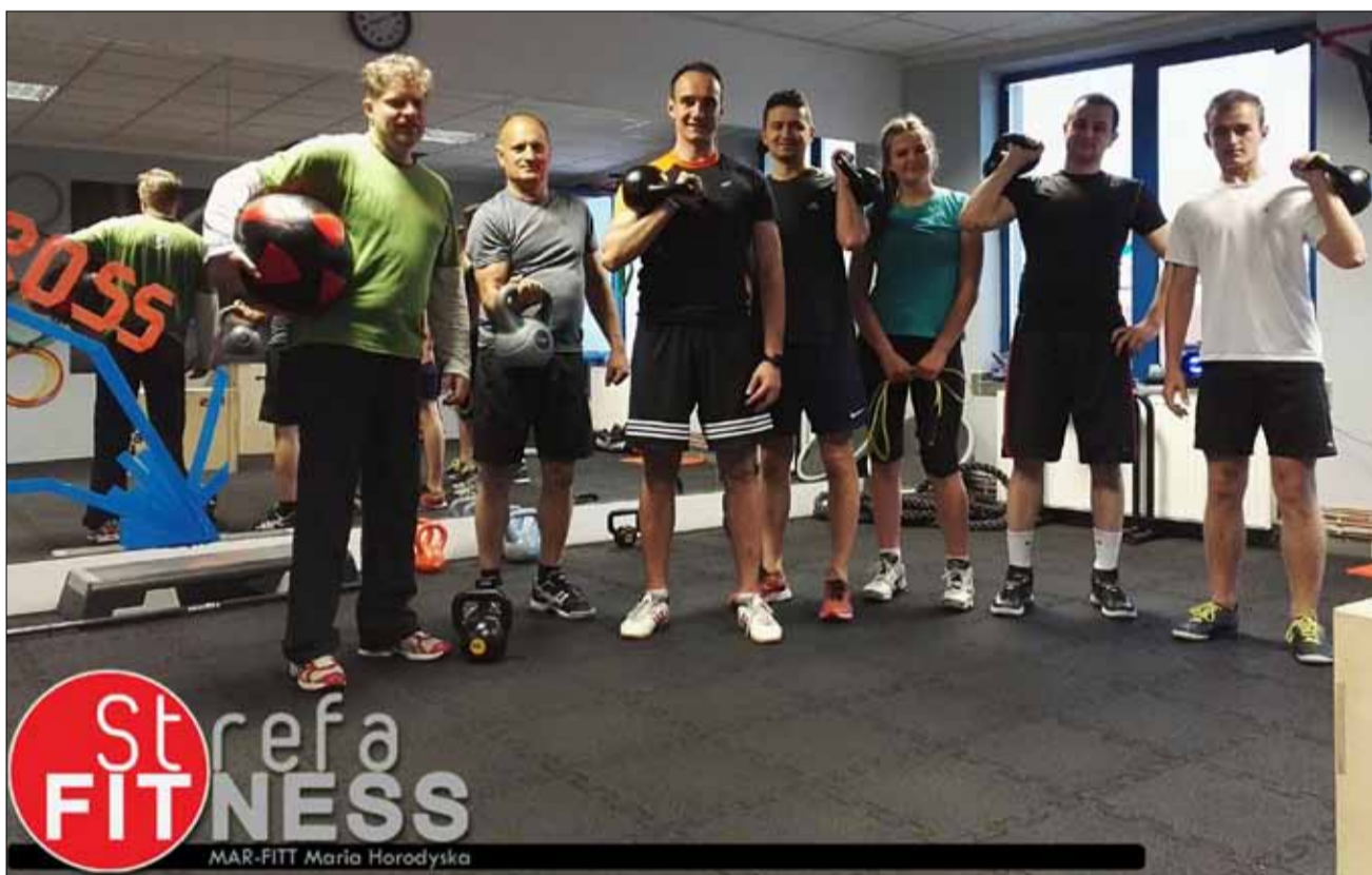
W ofercie klubu można znaleźć m.in. zajęcia crossowe

Jak przekonuje właścicielka, do zajęć grupowych co jakiś czas dołączają nowe osoby. - Często klienci boją się, że nie będą w stanie dorównać grupie, która od jakiegoś czasu ćwiczy. Szybko jednak przekonują się, że wcale tak nie jest. Na początku instruktor poświęca więcej uwagi osobie, która dopiero zaczyna ćwiczyć. Nie ma więc obawy, że ktoś sobie nie poradzi – podkreśla. W ostatnim czasie aktywne spędzanie czasu wolnego staje się coraz bardziej popularne. Zauważa to także właścicielka Strefy Fitness. Jakie zajęcia powinna wybrać osoba początkująca? - Najważniejsze jest to, aby osoba, która do nas przychodzi sprecyzowała, co chciałaby osiągnąć. Motywacje mogą być różne, od chęci utraty wagi, zmiany samopoczucia do zwiększenia sprawności fizycznej. Po ustaleniu priorytetów jesteśmy w stanie dobrać odpow-