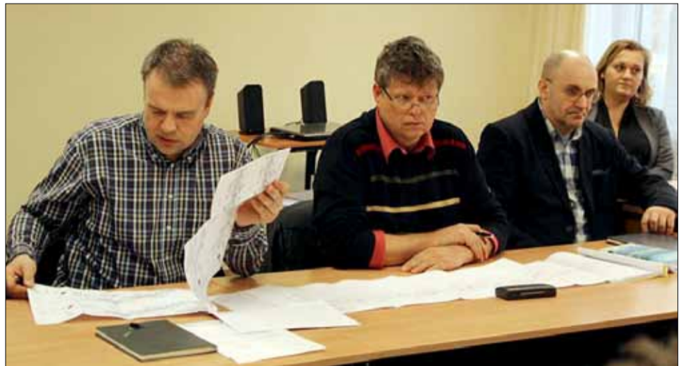
Pracownicy strzeleńskiego magistratu, projektant i przedstawiciel wykonawcy odpowiadali na pytania mieszkańców

Warto przypomnieć, że inwestycję sfinansują po połowie zarządca drogi, czyli Dolnośląska Służba Dróg i Kolei we Wrocławiu oraz strzeleński samorząd. Nad realizacją przedsięwzięcia czuwa gmina Strzelin, która została inwestorem zastępczym. Zadanie jest możliwe do realizacji dzięki zawartemu porozumieniu pomiędzy Województwem Dolnośląskim a gminą Strzelin. Prace powinny rozpocząć się za około dwa tygodnie.