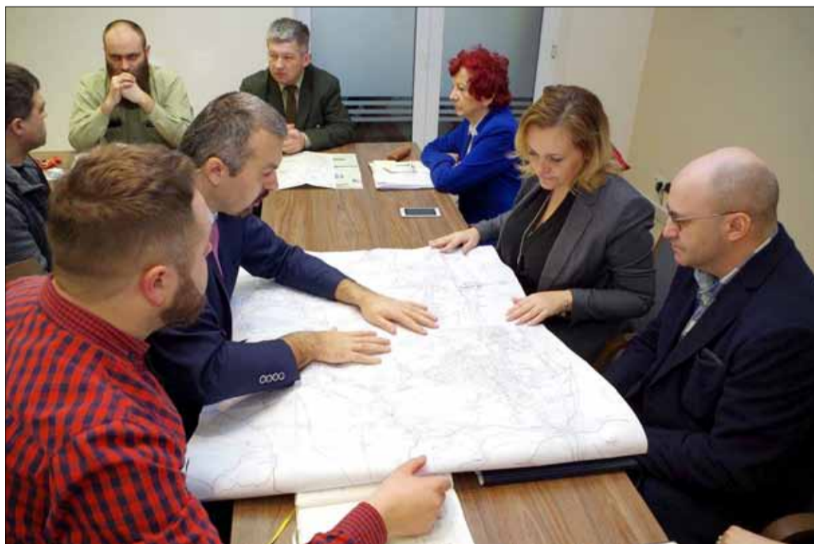
Samorządowcy z Ziębic i Strzelina dyskutowali na temat rozwoju tras rowerowych

Turyści oraz lokalni pasjonaci rowerowych wypraw po malowniczych Wzgórzach Strzełińskich od lat zwracają uwagę m.in. na kiepskie oznakowanie tras rowerowych i ich ubogą infrastrukturę. Sygnalizują też miejsca, w których występują problemy z przejezdnością. Włodarze Strzelina i Ziębic chcą zmienić ten niekorzystny stan rzeczy i to właśnie „rowerowej” tematyce było poświęcone spotkanie, zorganizowane 1 marca w siedzibie Nadleśnictwa Henryków. Miejsce spotkania nie było przypadkowe, bo to przez teren henrykowskiego nadleśnictwa przebiega większość tras pieszych i turystycznych łączących gminy Strzelin i Ziębice. Warto podkreślić, że władze nadleśnictwa są bardzo otwarte na współpracę i z zainteresowaniem oraz życzliwością przyjmują wszelkie inicjatywy służące poprawie infrastruktury tras turystycznych. Nadleśniczy Piotr Bubniewicz podkreślił jednak, że nadleśnictwu zależy, aby