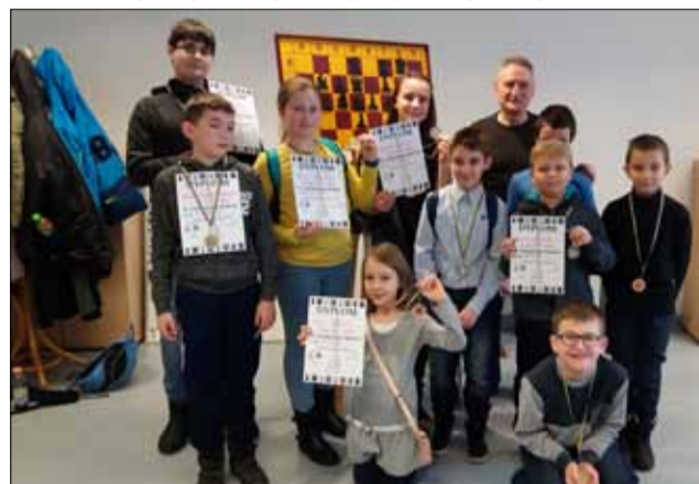
SCSE Dzieci mogły spróbować swoich sił w turniejach szachowych