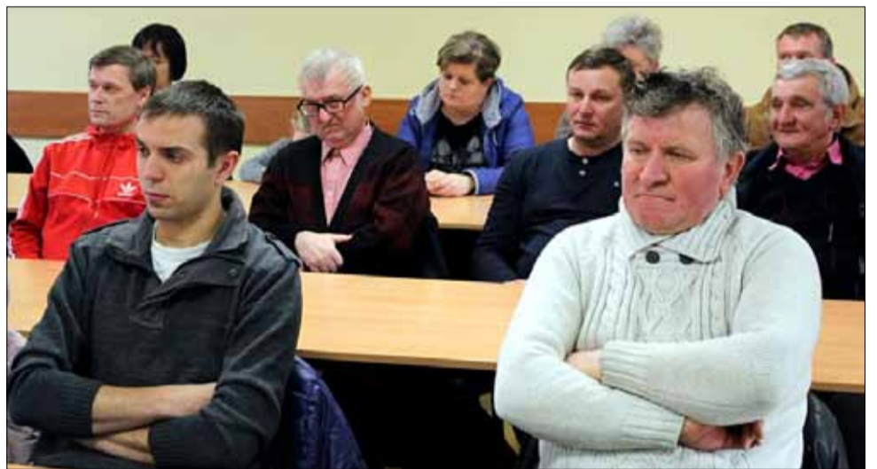
Na spotkanie przybyło sporo mieszkańców

Szykują się inwestycje i spore utrudnienia w ruchu