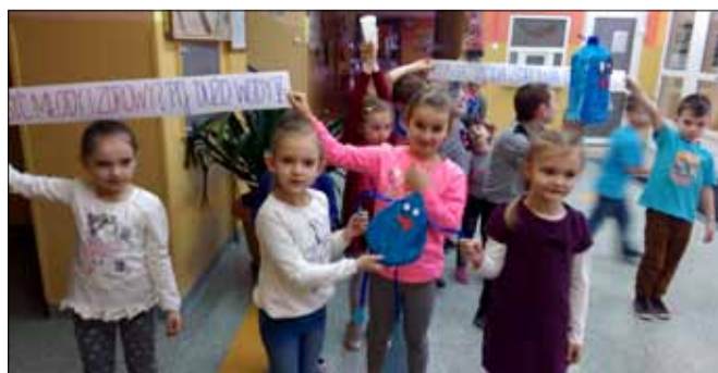
Transparenty z hasłami miały przypomnieć, jak ważne dla organizmu człowieka jest picie odpowiedniej ilości wody