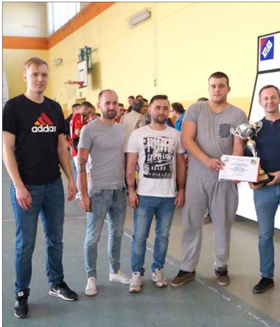
Zwycięzcą tegorocznej edycji Halowej Ligi Piłki Nożnej został zespół Green Install