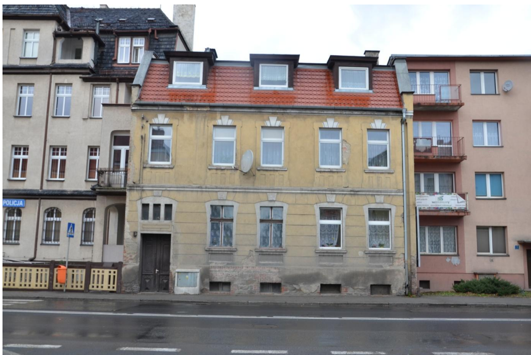
Fot. Strzelin – Dom mieszkalny ul. Wolności 17