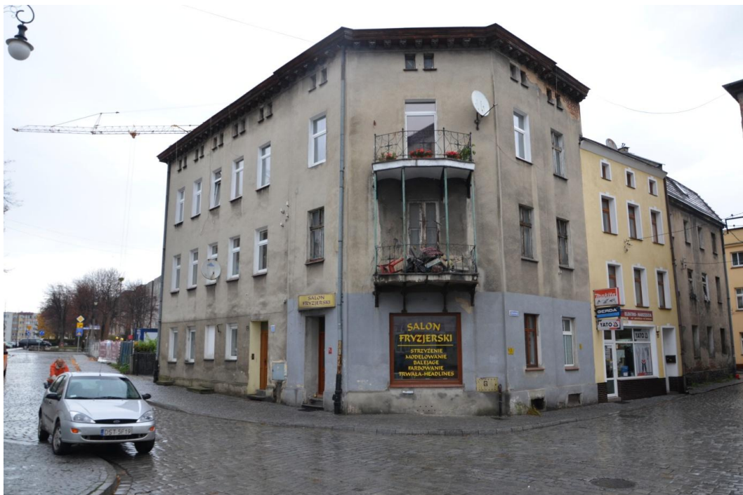
Fot. Strzelin – Dom mieszkalny ul Wodna 5