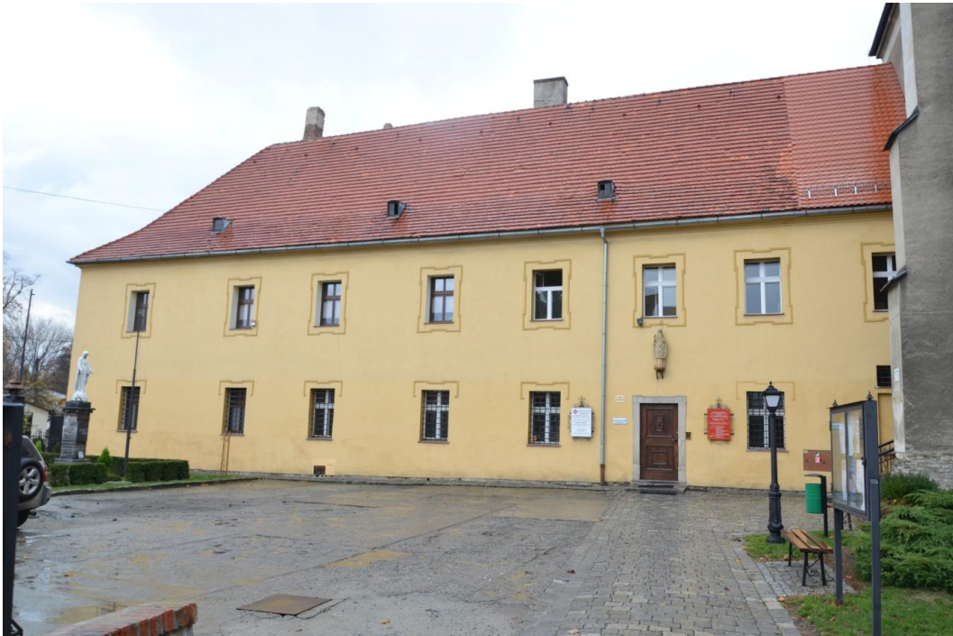
Fot. Strzelin – Klasztor ss. Boromeuszek