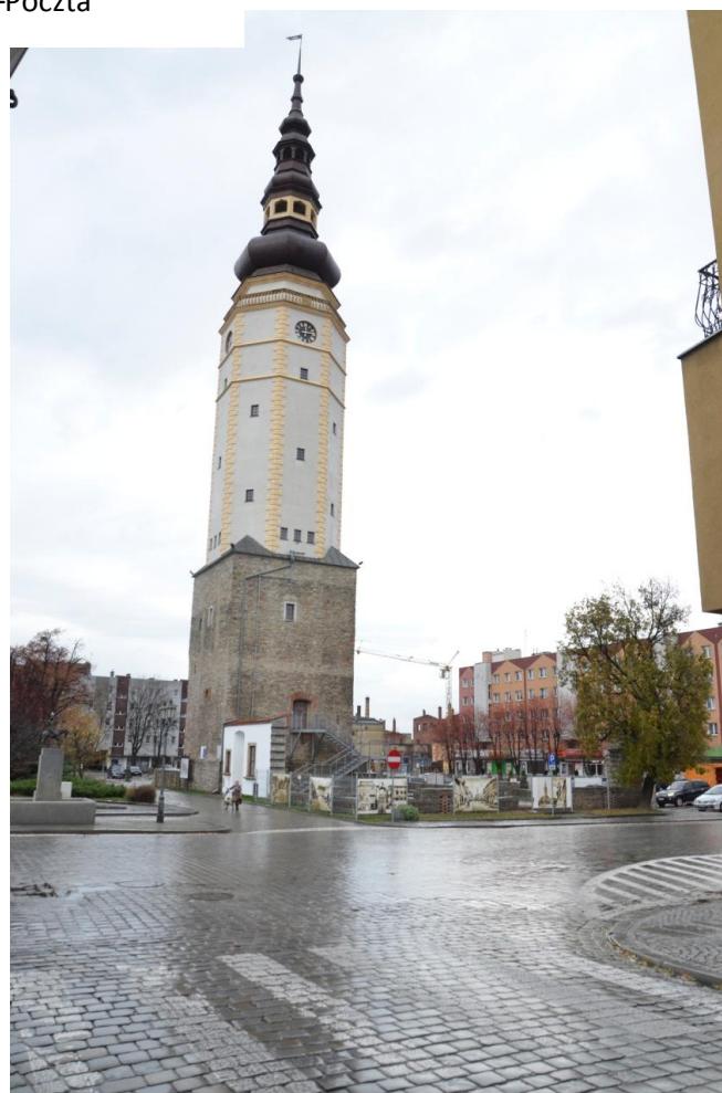
Fot. Strzelin – Wieża Ratuszowa