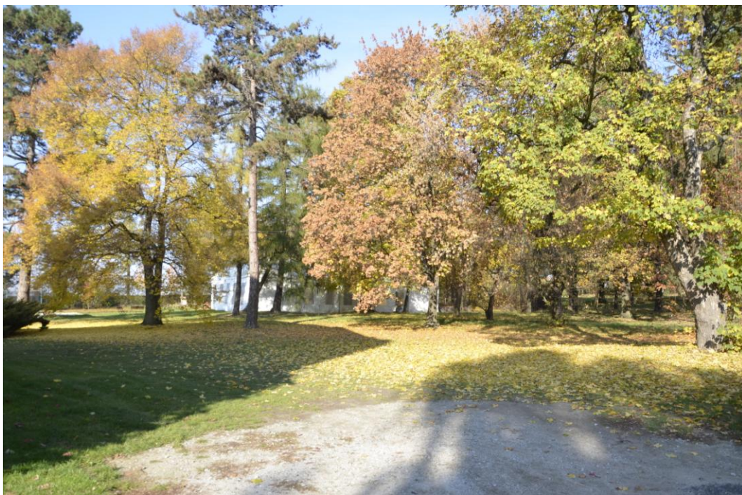
Fot. Krzepice - park