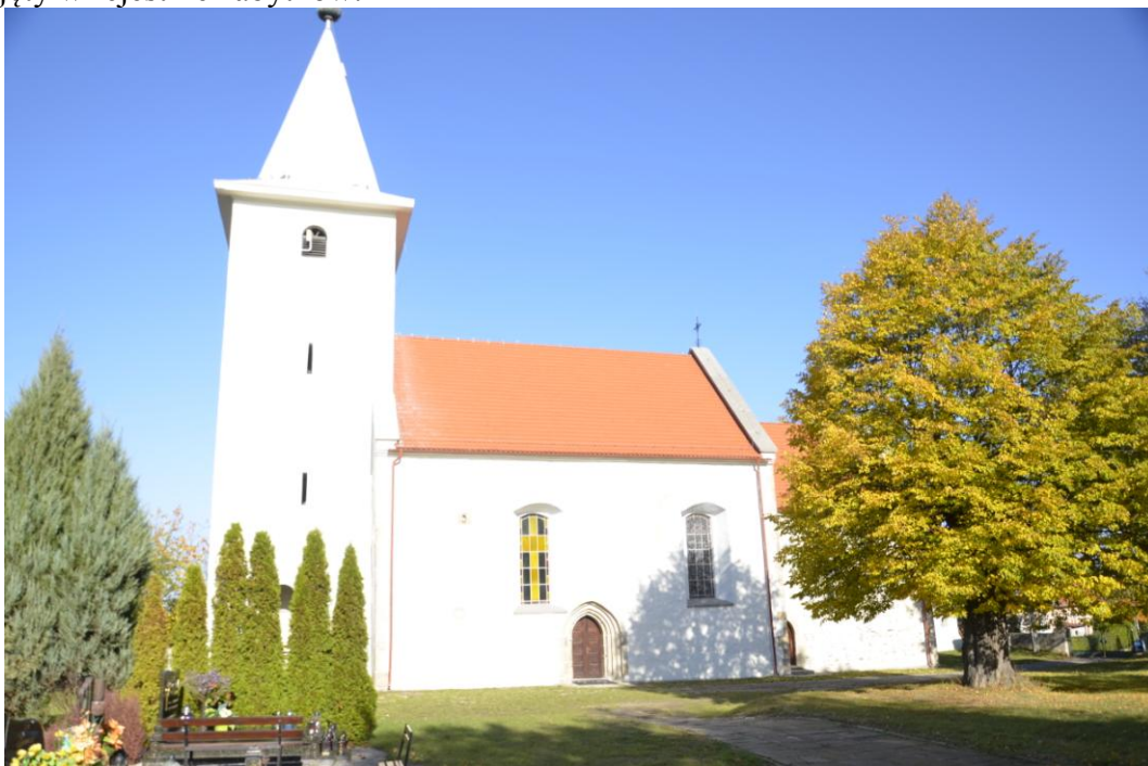
Fot. Karszów - Kościół fil. Niepokalanego Poczęcia NMP

Na terenie wsi znajduje się wpisany do rejestru zabytków cmentarz przykościelny o powierzchni 0.3 ha. W związku z tym iż pierwsze wzmianki o znajdującym się tam obecnie odbudowanym kościele pochodzą z XIII w. należy przyjąć, że najstarsze pochówki należy datować na średniowiecze. Kościół w stylu gotyckim został zniszczony w trakcie działań II wojennych i ulegał destrukcji jeszcze w latach powojennych. Obecny odbudowany kościół jest ujęty w rejestrze zabytków.