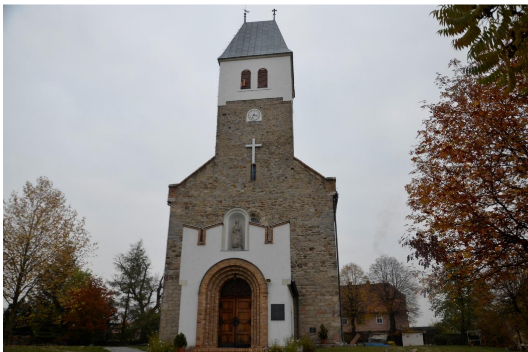
Fot. Biały Kościół - Kościół p. w. Najświętszej Marii Panny.