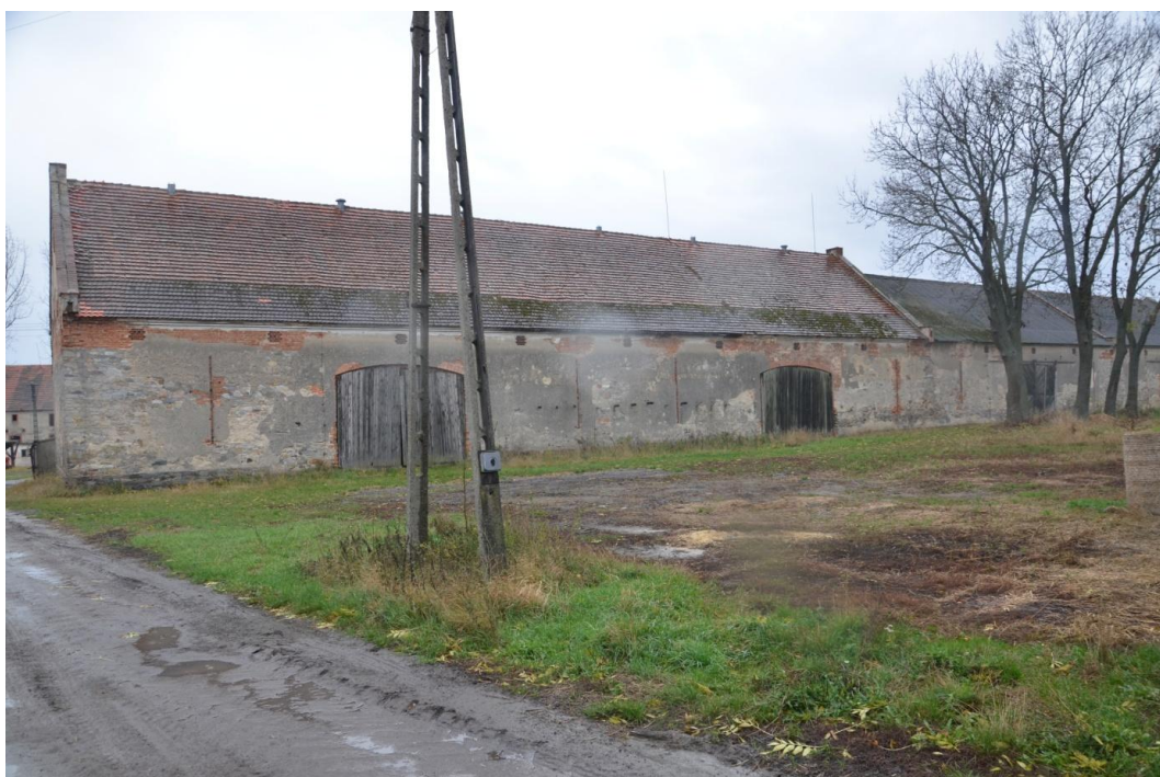
Fot. Muchowiec – Stodoła III i IV