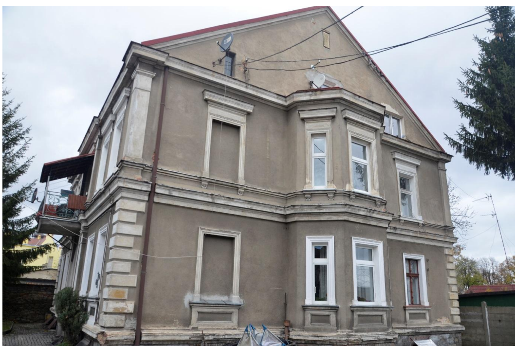
Fot. Strzelin – Dom mieszkalny ul. Brzegowa 10