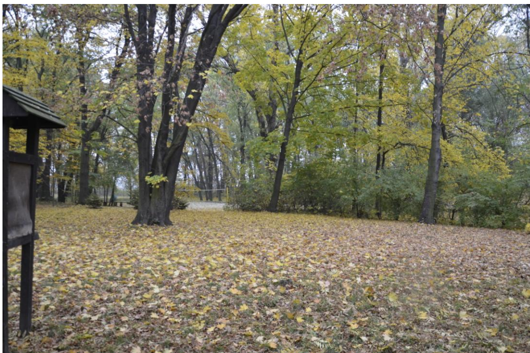
Fot. Ludów Polski - Park

Zabudowania majątku ziemskiego znajdują się terenie północno-wschodniej części wsi. Wzdłuż południowo-zachodniego skrzydła folwarku przybiega droga asfaltowa Strzeli – Wrocław. Pałac usytuowany jest na północ w znacznej odległości od folwarku, ponadto jest on oddzielony sadem i ogrodem warzywnym. Rezydencja otoczona jest o północy i wschodu parkiem. Fundamenty i cokoły pałac wykonane są z kamienne. Budynek murowany z cegły, otynkowany, dwuskrzydłowy, założony na planie litery „L”, podpiwniczony, dwu- i trzykondygnacyjny w partii ryzalitu. Pałac przykryty dwuspadowym dachem, nad ryzalitem znajduje się niski czterospadowy dach, natomiast nad tarasem jednospadowy. Fasada ośmioosiowa, z głównym wejściem znajdującym się w niższym skrzydle. Wejście poprzedzają schody i ganek. Elewacje przekształcone, dzielone lizenami i gzymsami, poza tym pozbawione detali architektonicznych.