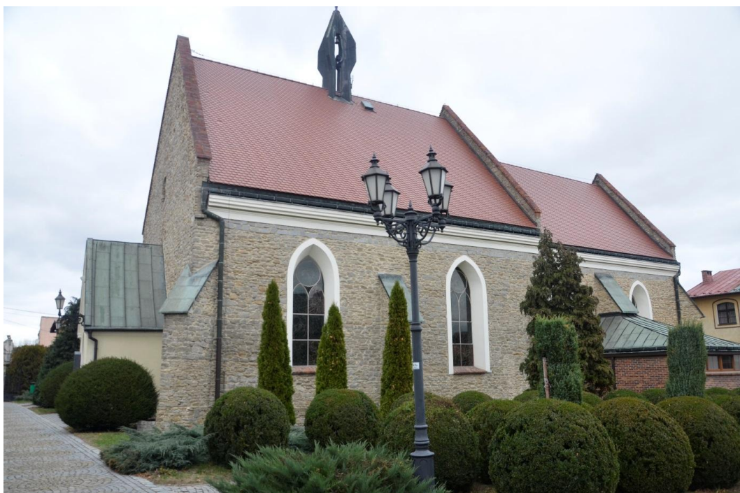
Fot. Strzelin – Kościół par. Matki Chrystusa i św. Jana od Ewangelii Braci Czeskich