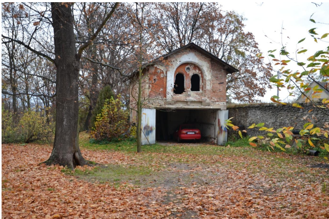
Altana w Parku