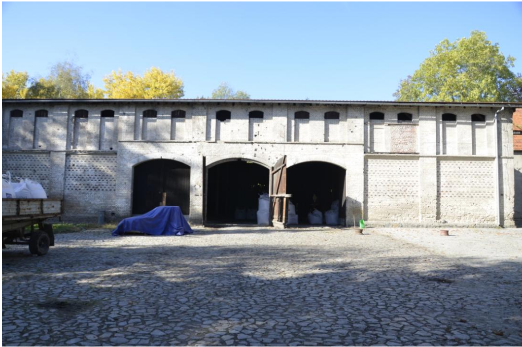
Fot. Dobrogoszcz – Stajnia.