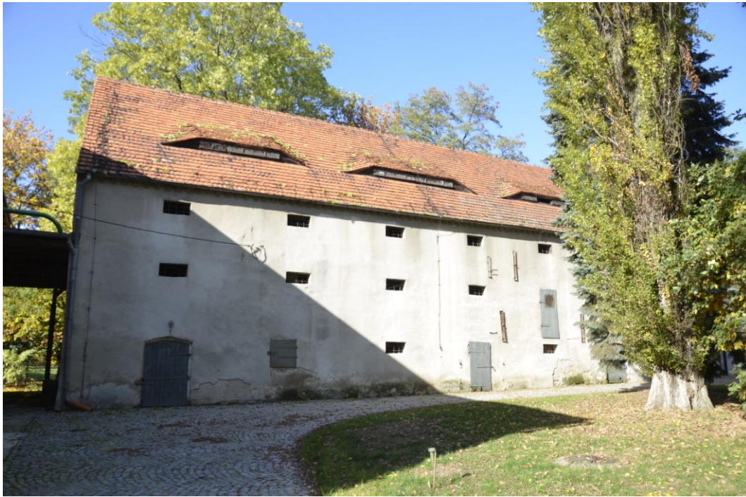
Fot. Dobrogoszcz – Spichlerz.