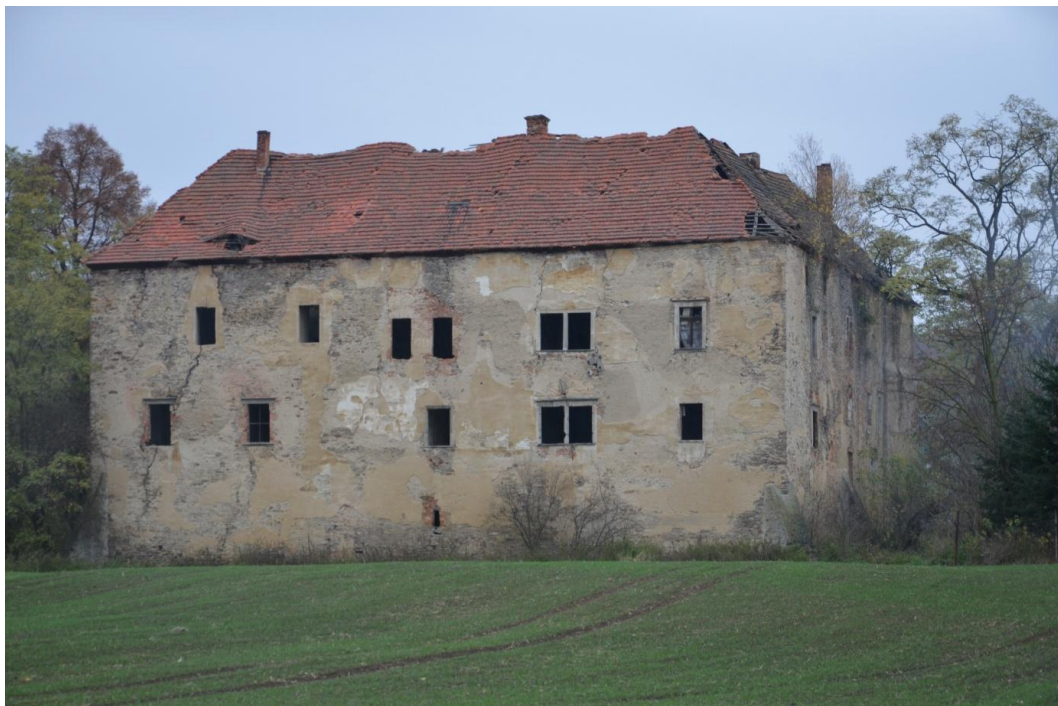
Fot. Nieszkowice - Pałac

zblizonym do litere „C”, składający się z trzech skrzydeł, których ramiona otwierają się w kierunku zachodnim tworzą prostokątny dziedziniec. Układ wnętrz jednotraktowy.