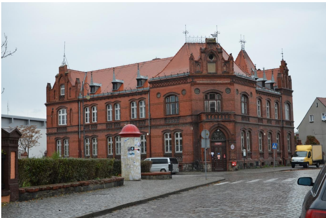
Fot. Strzelin –Pocza