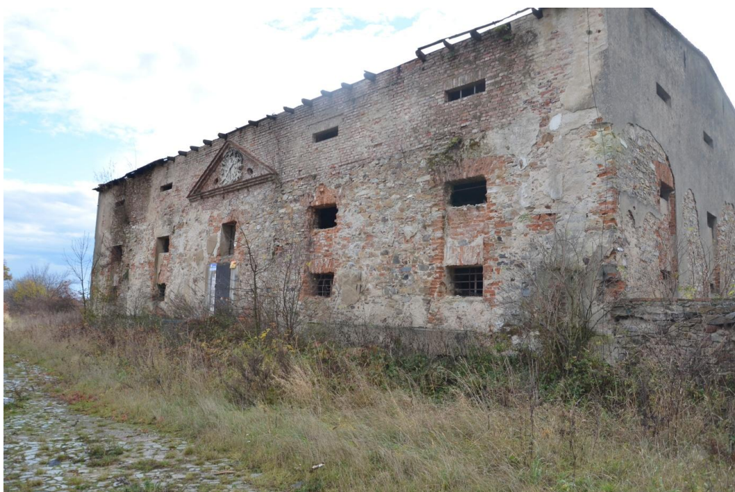
Fot. Żeleźnik – Spichlerz.