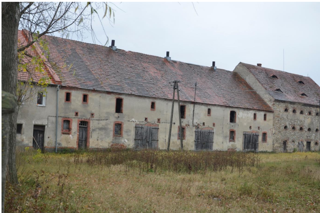
Fot. Muchowiec – Stodoła.