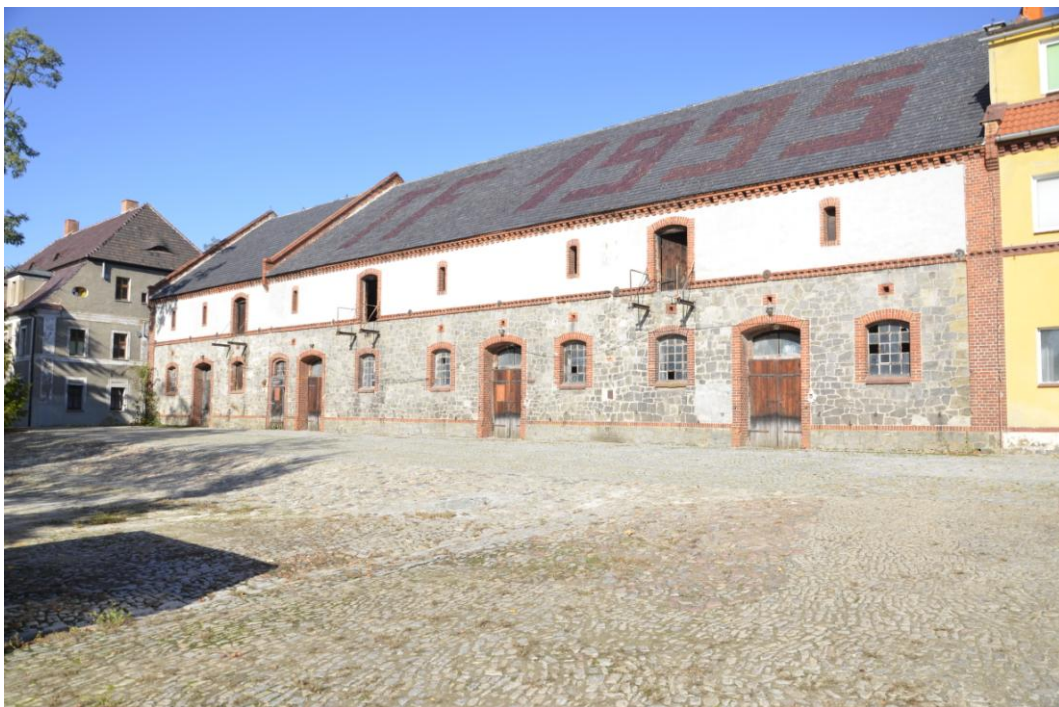
Fot. Dobrogoszcz – Stodola