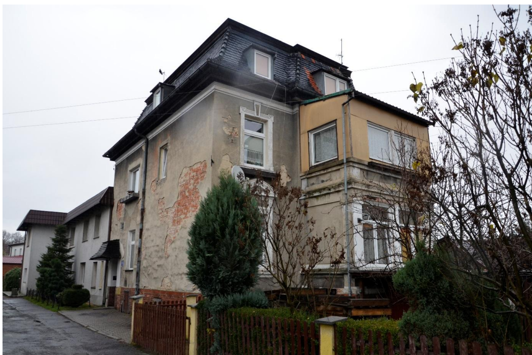
Fot. Strzelin – Dom mieszkalny ul. Brzegowa 17 b