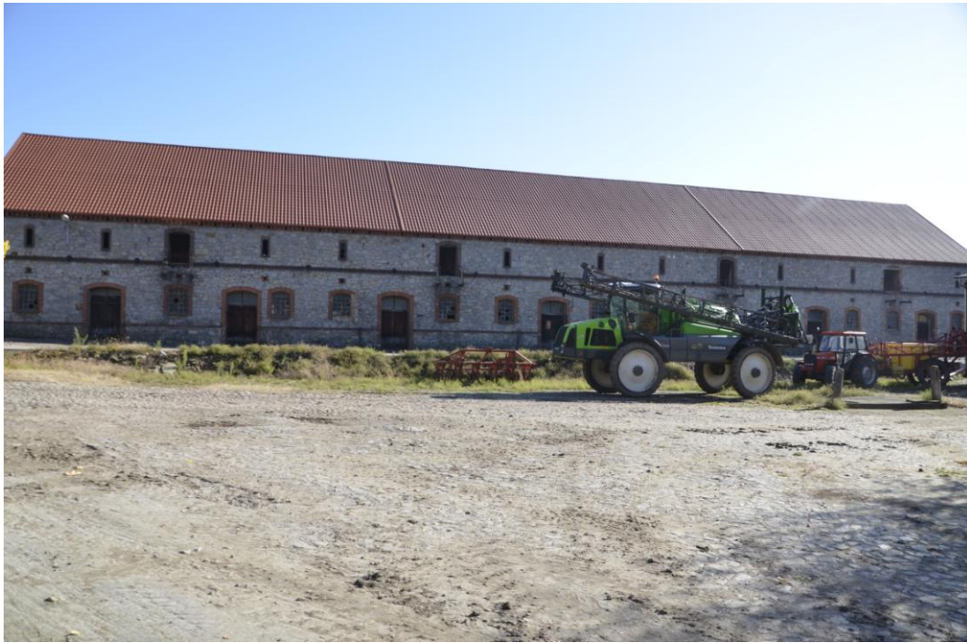
Fot. Dobrogoszcz – Stodola