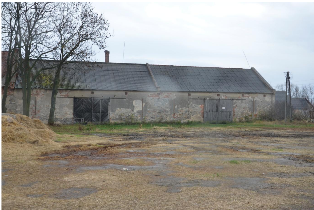
Fot. Muchowiec – Stodoła I i II