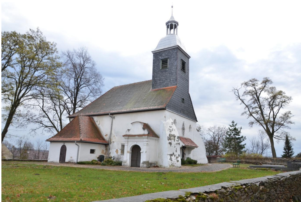
Fot. Źeleźnik – Kościół p. w. Matki Boskiej Szkaplerznej.