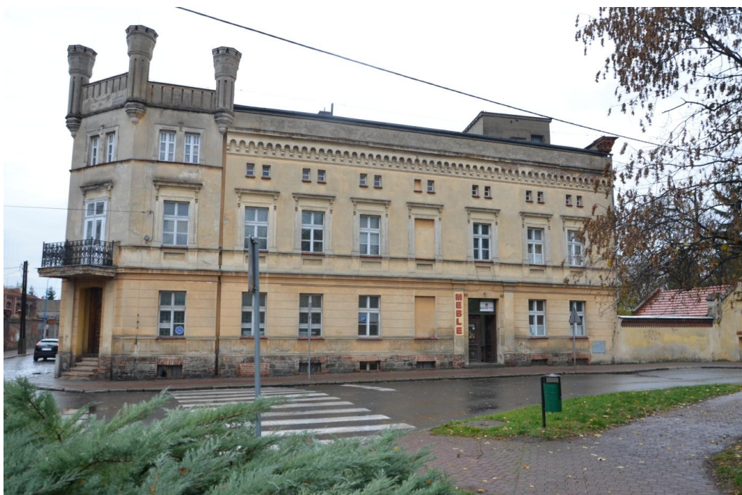
Fot. Strzelin – Zespół mlyna