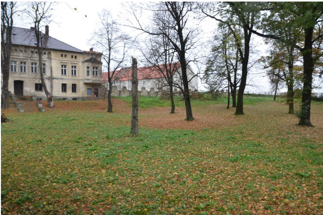
Fot. Wąwolnica – Park pałacowy

Rezydencja o cechach neorenesansowych, wzniesiona po 1840 roku, remontowana po 1985 roku. Pałac murowany z kamienia i cegły, otynkowany, założony na planie prostokąta, podpiwniczony, dwukondygnacyjny, z zagospodarowanym poddaszem, nakryty dachem czterospadowym i płaskim nad dobudówką. Elewacje zachowały liczne detale architektoniczne: boniowane przyziemie, proste gzymsy nadokienne. Pałac skierowany jest elewacją frontową na dziedziniec folwarczny. Wokół dziedzińca zabudowania gospodarcze z drugiej połowy XIX w. Od południa do rezydencji przylega niewielki park krajobrazowy z drugiej połowy XIX w. W parku dominuje liściasty drzewostan: dęby, kasztanowce, jesiony.