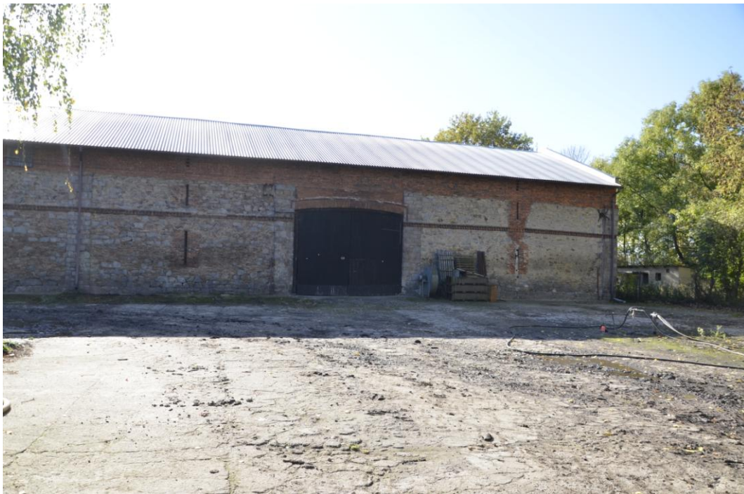
Fot. Dobrogoszcz – Magazyn