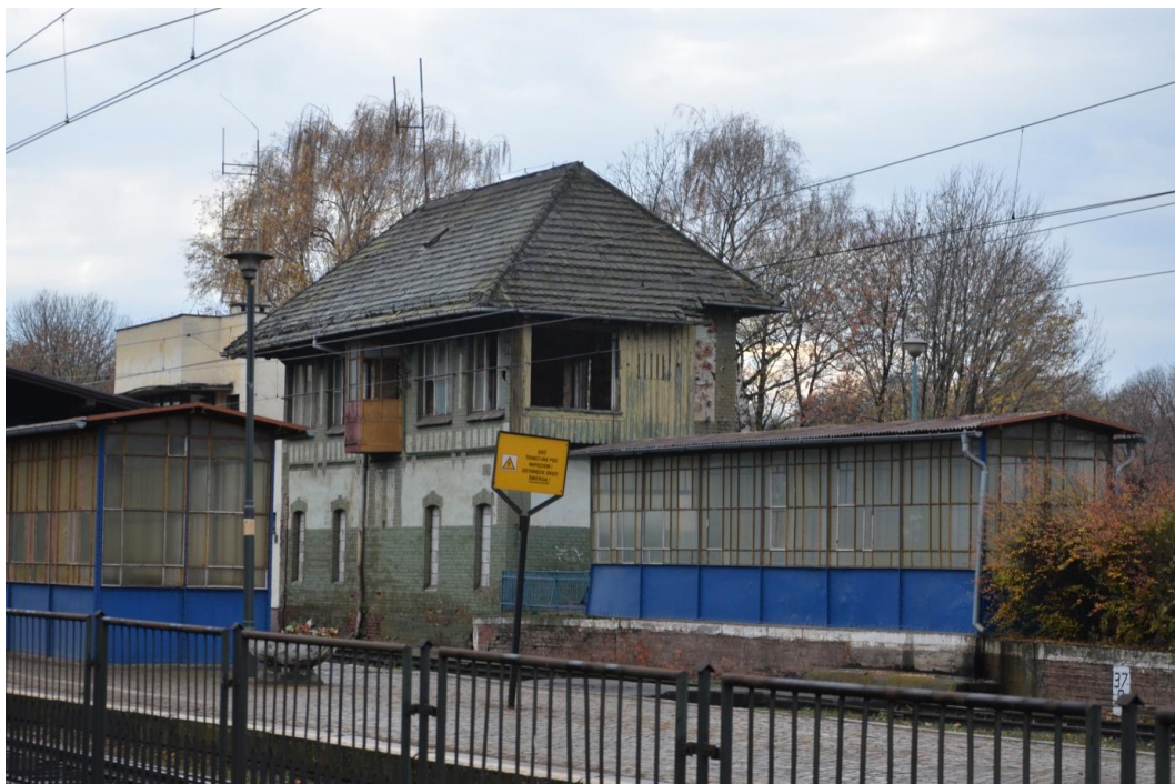
Fot. Strzelin – Dworzec - Nastawnia