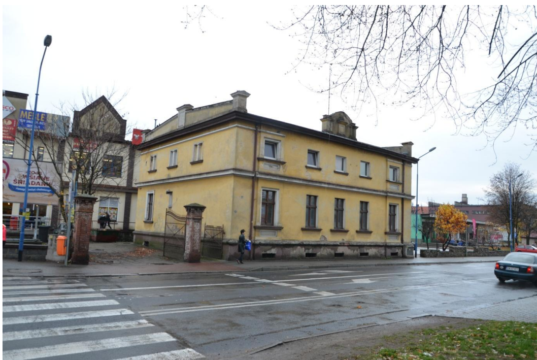
Fot. Strzelin – Dom mieszkalny ul. Wolności 12