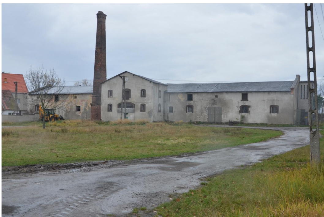
Fot. Muchowiec – Gorzelnia