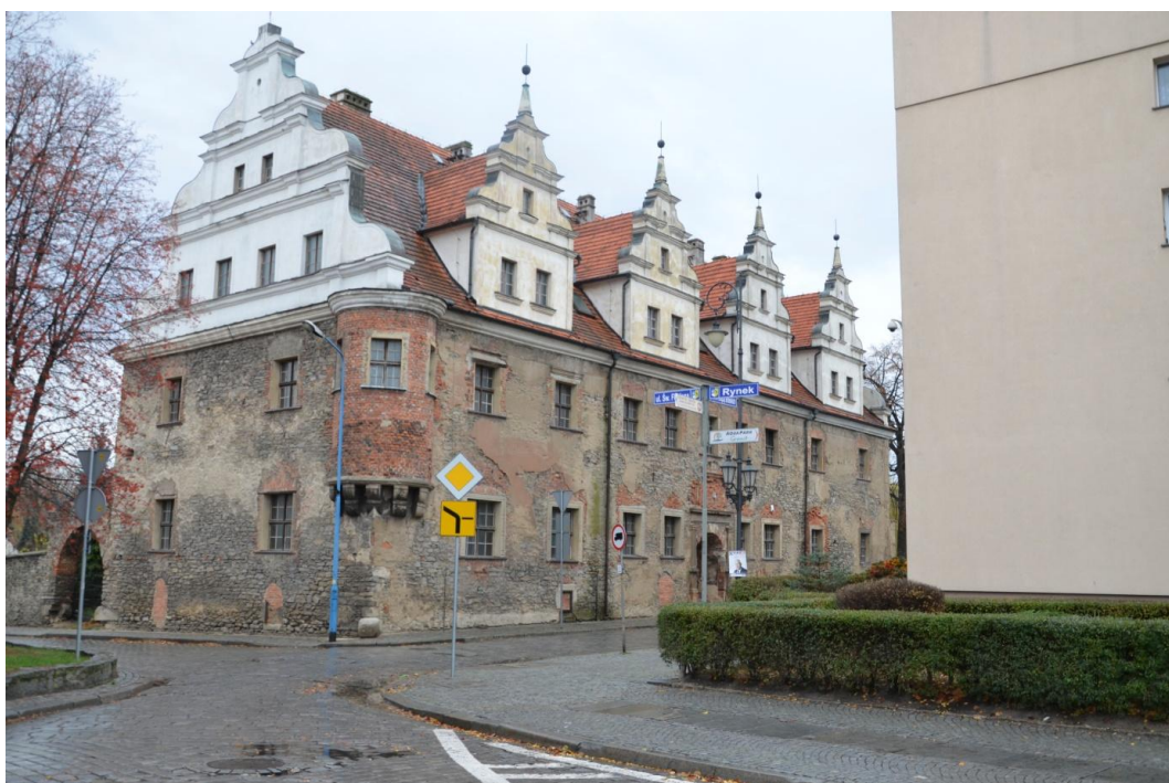
Fot. Strzelin – Dom Książąt Brzeskich