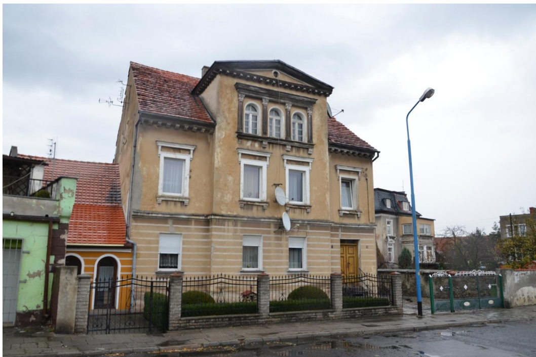
Fot. Strzelin – Dom mieszkalny – ul. Brzegowa 13