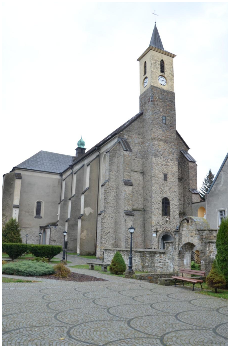
Fot. Strzelin –Strzelin, Kościół p.w. Podwyższenia Krzyża Świętego