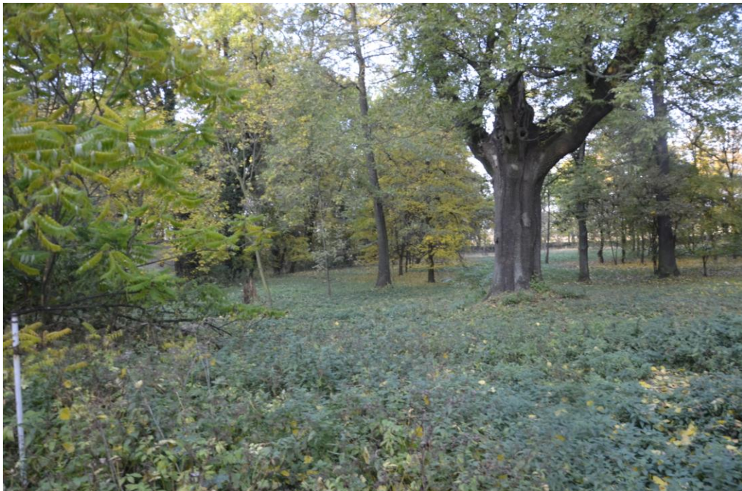
Fot. Warkocz – Park krajobrazowy