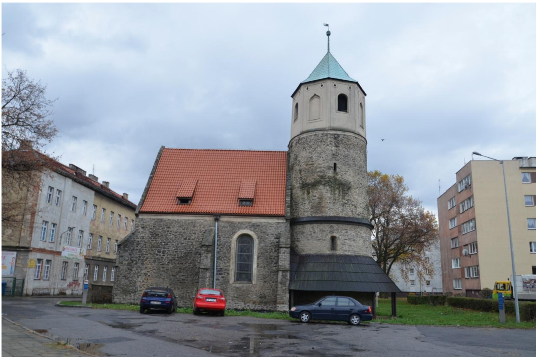
Fot. Strzelin – Kościół św. Gotarda