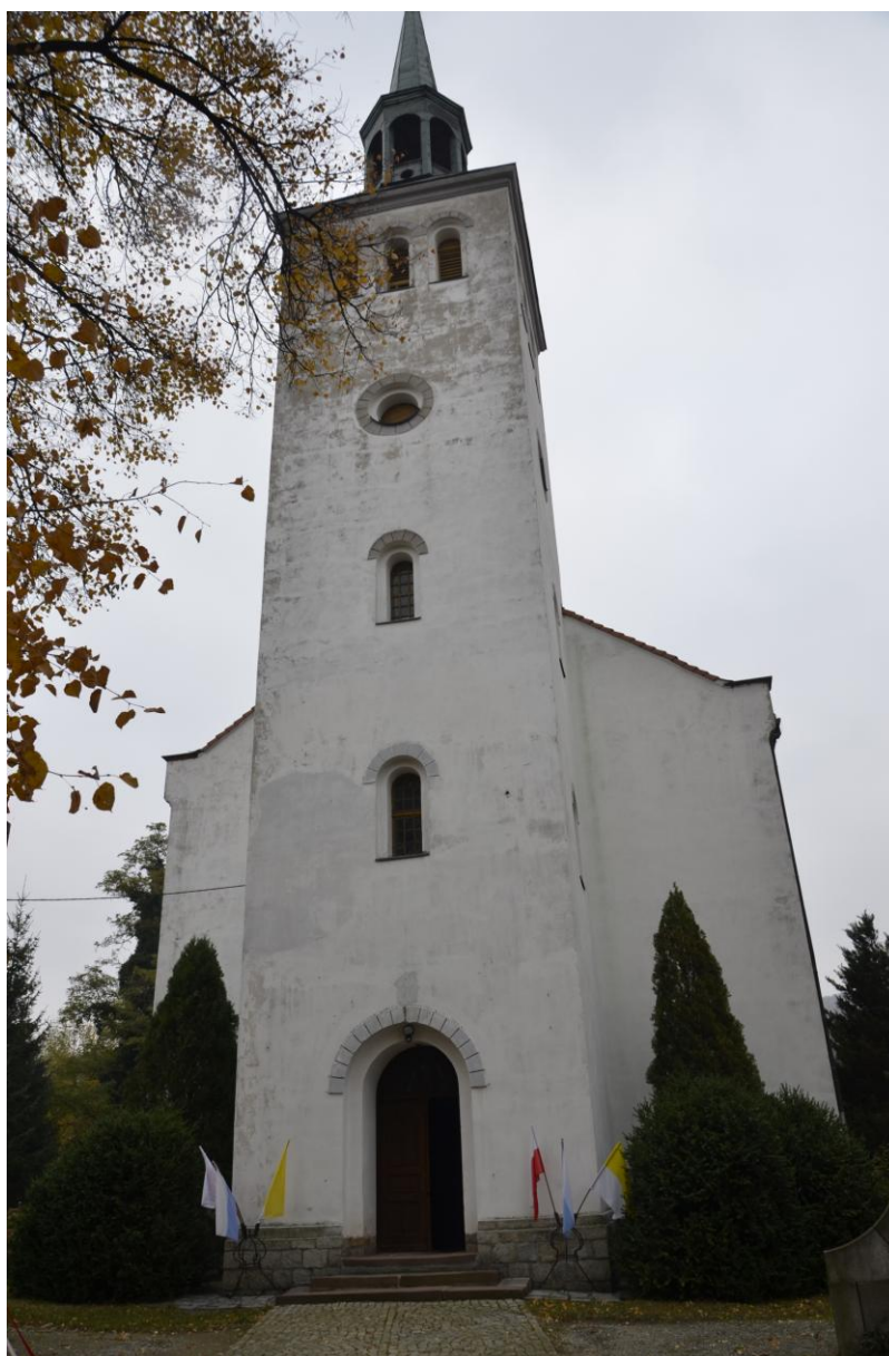
Fot. Nowolesie - Kościół parafialny p.w. Św. Marcina

założonymi na planie prostokąta aneksami, w których znajdują się zakrystia i pomieszczenia o charakterze pomocniczym. Korpus nawowy, salowy, założony na rzucie prostokąta, w jego zachodniej części znajduje się chór. Od zachodu na osi nawy wyodrębniona jest w rzucie wieża o planie czworobocznym. Kościół orientowany, jednonawowy, z wyodrębnionym niższym od wydłużonej nawy, prezbiterium i czworoboczną pięciokondygnacyjną wieżą. Po obu stronach prezbiterium znajdują się niższe od niego prostopadłościennie aneksy mieszczące zakrystie i pomieszczenie pomocnicze. Korpus nawowy został nakryty dachem dwuspadowym, natomiast dachy aneksów są dwupołaciowe, wieża nakryta jest dachem czterospadowym, dzwonnica wieży w kształcie ostrosłupa. Pokrycie dachowe nawy, prezbiterium i aneksów wykonane jest z dachówki ceramicznej. Dzwonnica wieży pokryta blachą. W kościele większość posadzki wykonana została z płytek ceramicznych, natomiast w wieży znajduje się podłoga drewniana.