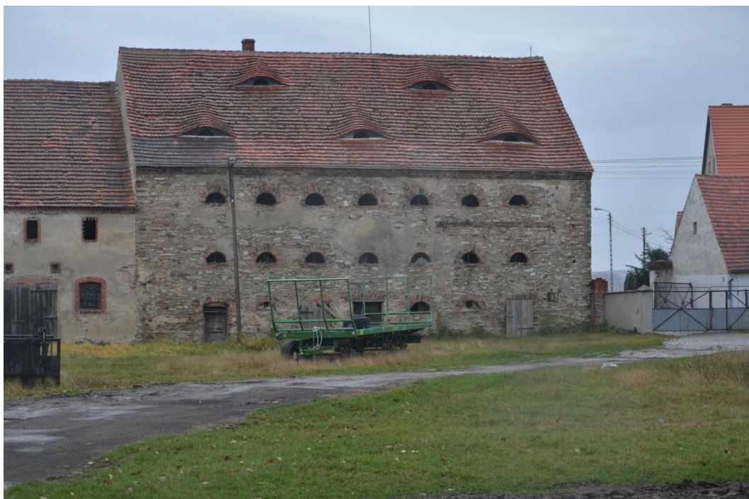
Fot. Muchowiec – Spichlerz