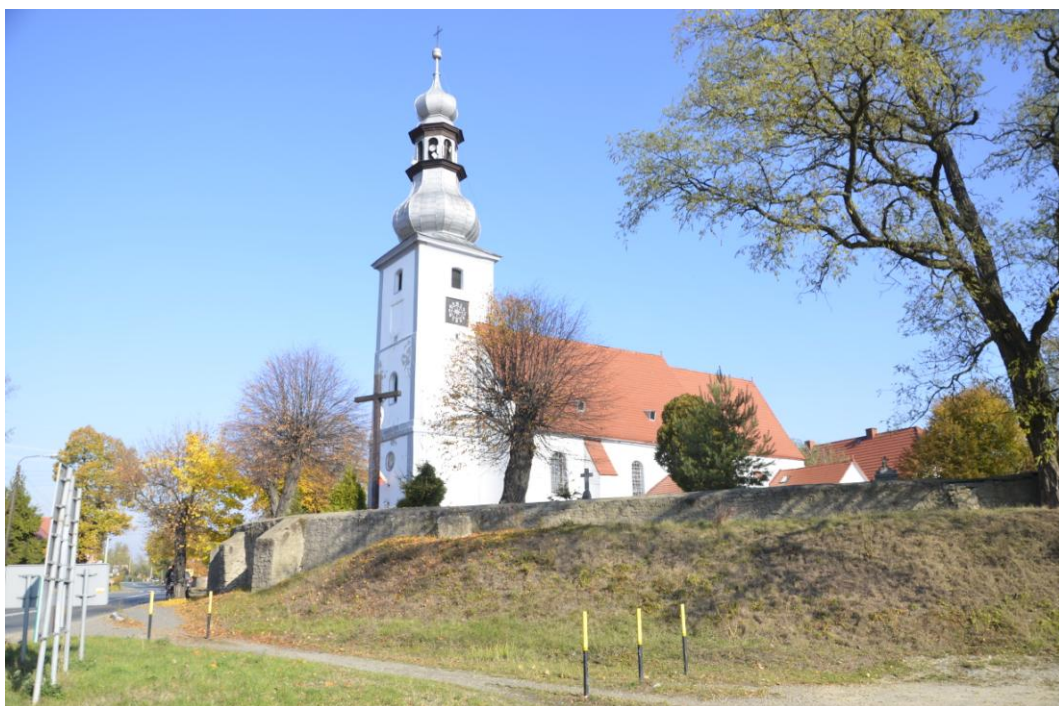
Fot. Brożec - Kościół p.w. Świętego Jakuba

W tejże miejscowości znajduje się również pochodzący z I połowy XIX w. pałac. Usytuowany jest on na wschód od drogi ze Strzelina do Oławy, i w kierunku południowym od kościoła parafialnego. Pałac posiada dziedziniec, otoczony trzema skrzydłami zabudowań gospodarczych, od ulicy oddziela go metalowe ogrodzenie (przed fasadą oraz na południe od niej) oraz murem kamiennym z bramą od strony południowo-zachodniej narożnika pałacu na