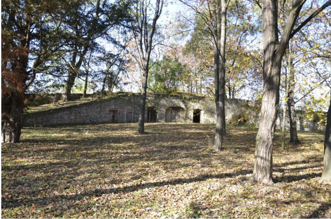
Fot. Dobrogoszcz – park oraz budowla parkowa.