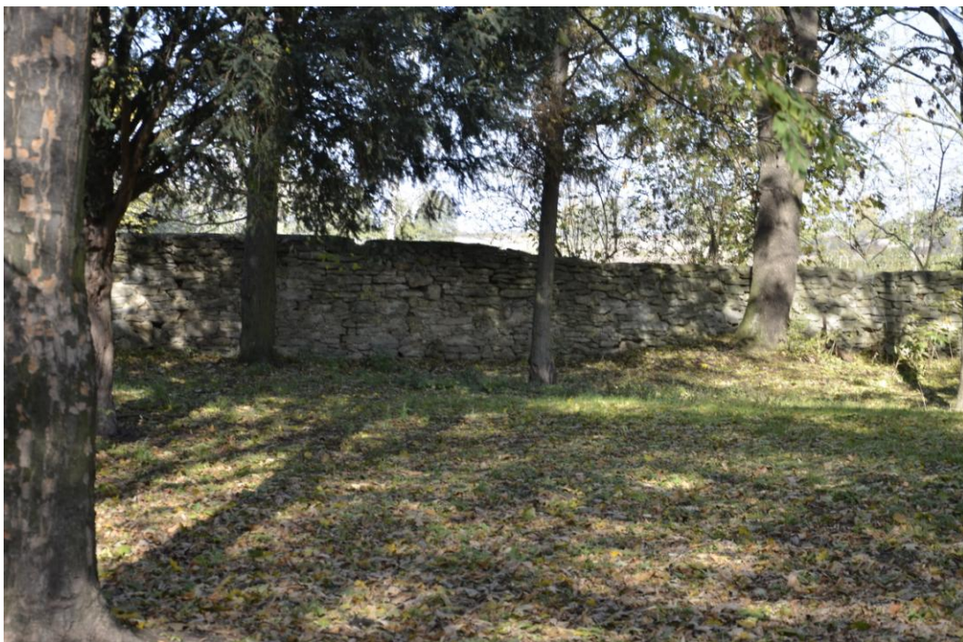
Fot. Dobrogoszcz – Ogrodzenie zespołu.