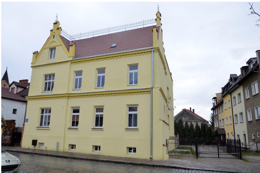
Fot. Strzelin – Dom mieszkalny ul. Stasica 4