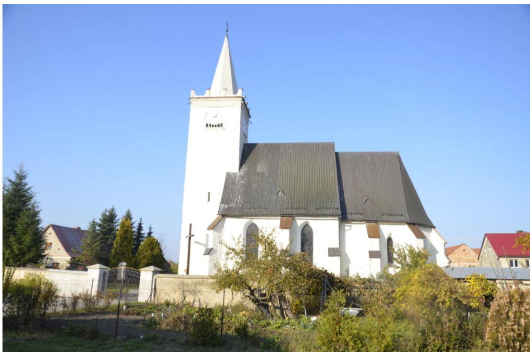
Fot. Biedrzychów – Kościół p. w. Narodzenia Św. Jana Chrzciciela.