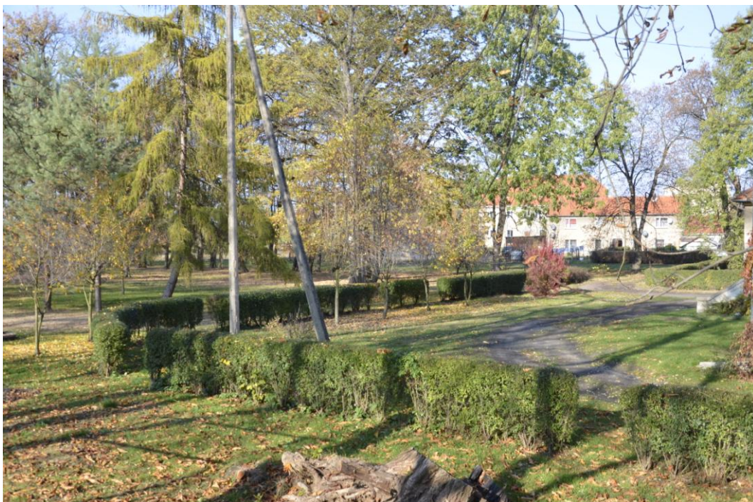
Fot. Głęboka – Zespół parkowy