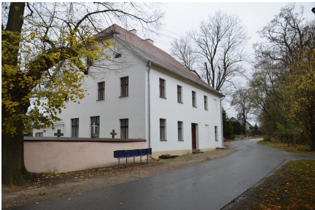
Fot. Dankowice – budynek plebanii