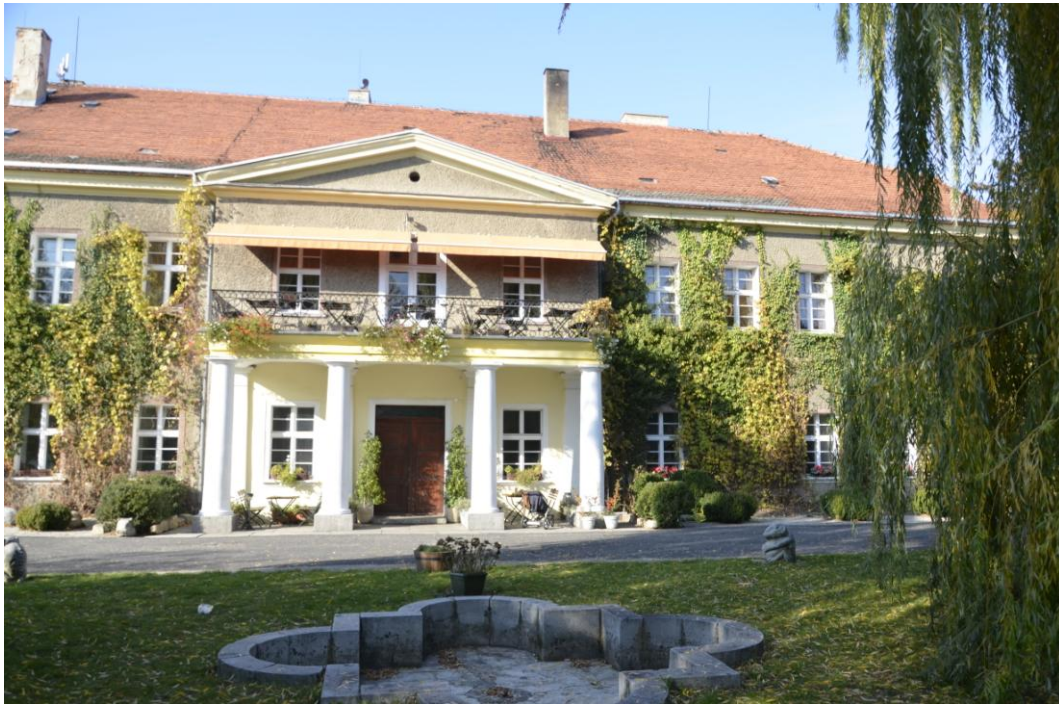
Fot. Krzepice - pałac