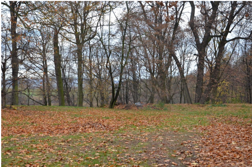
Fot. Železnik – Park