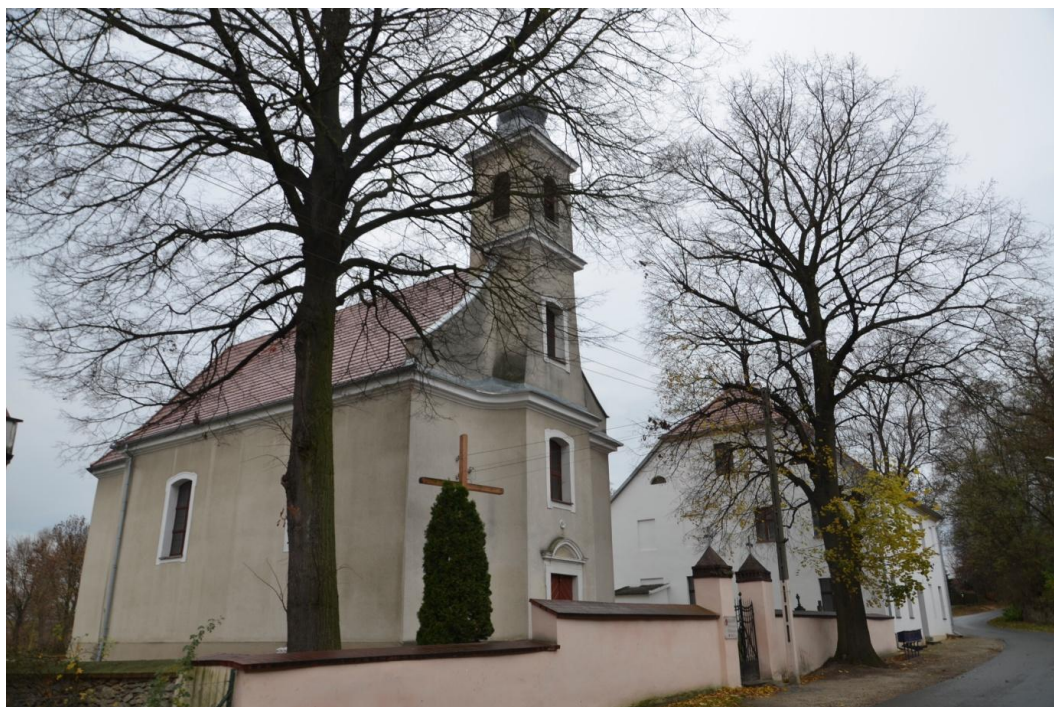
Fot. Dankowice - Kościół p.w. Świętego Józefa Oblubieńca.

Kościół parafialny p.w. Świętego Józefa Oblubieńca, orientowany, usytuowany jest przy północnej stronie drogi ze Strzelina do Niemczy. Kościół jest otoczony kamiennym murem z furtką od strony zachodniej, od strony południowej za murem znajdują się plebania oraz zabudowania gospodarcze. Kościół jednonawowy, został wzniesiony w latach 1817-1819, restaurowany w połowie XIX w. Ściany kościoła wykonane są z granitu, otynkowane, z kamiennym cokołem profilowanym gzymsem koronującym. Korpus przykryty sklepieniem zwierciadlanym, natomiast kruchta i zakrystia sklepione kolebami, więźba dachowa wykonana z drewna, a dach pokryty został podwójną dachówką karpiówką, hełm wieży po remoncie został obity blachą ocynkową. Posadzka w korpusie wykonana została z terakoty, natomiast w kruchcie posadzkę ułożono z płyt kamiennych. Na emporę prowadzą schody ślimakowe cementowe. Otwory okienne nierozglifione, zamknięte łukiem odcinkowym w tynkowych uszakowych opaskach. Kościół zbudowany został na planie prostokąta z węższym prezbiterium o zaokrąglonych narożach. Od strony południowej do prezbiterium przylega zakrystia zbudowana na planie prostokąta, natomiast od strony zachodniej do kościoła przylega wieża.