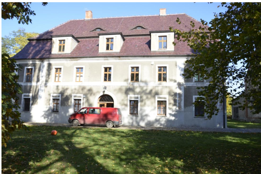
Fot. Dobrogoszcz – Pałac.

Oficyna mieszkalna wybudowana została około 1910 r., stanowi północną część wschodniego skrzydła zespołu. Dopelnienie tego skrzydła stanowi znajdująca się od południa była stajnia. Po wschodniej stronie oficyny znajduje się skromny skwerek. Budynek jest murowany, fundamenty i cokół wykonane z kamienia, natomiast wyższe części ceglane. Stropy budynku nad parterem są ceglane, nad piętrami drewniane. Więźba dachowa drewniana, pokrycie dachu wykonane jest z podwójnej dachówki karpiówki. Dach dwuspadowy, poddasze w części użytkowe, w połaciach dachu znajdują się facjatki. Posadzki parteru w holu i klatce schodowej wykonane są z lastriko, w piwnicach z cegieł, natomiast pozostałe drewniane. Otwory drzwiowe i okienne prostokątne. Budynek założony jest na planie prostokąta, trzytraktowy, bryła budynku zwarta, podpiwniczona i dwukondygnacyjna.